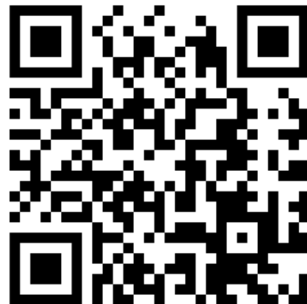
Foto rechts: QR-Code für das Herunterladen der App naturbeobachtung.at/ Projekt Kirchturmtiere.

Foto links: Jetzt Kirchturmtiere melden mit der neuen App „naturbeobachtung.at/ Projekt Kirchturmtiere“