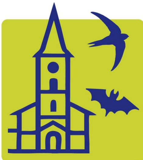
Foto: Logo des Projekts Kirchturmtiere.at Die beigefügten Fotos stehen Ihnen bei Angabe des angeführten Fotoautors © und im Zusammenhang mit dieser Aussendung zur Verfügung.

Foto rechts: QR-Code für das Herunterladen der App naturbeobachtung.at/ Projekt Kirchturmtiere.